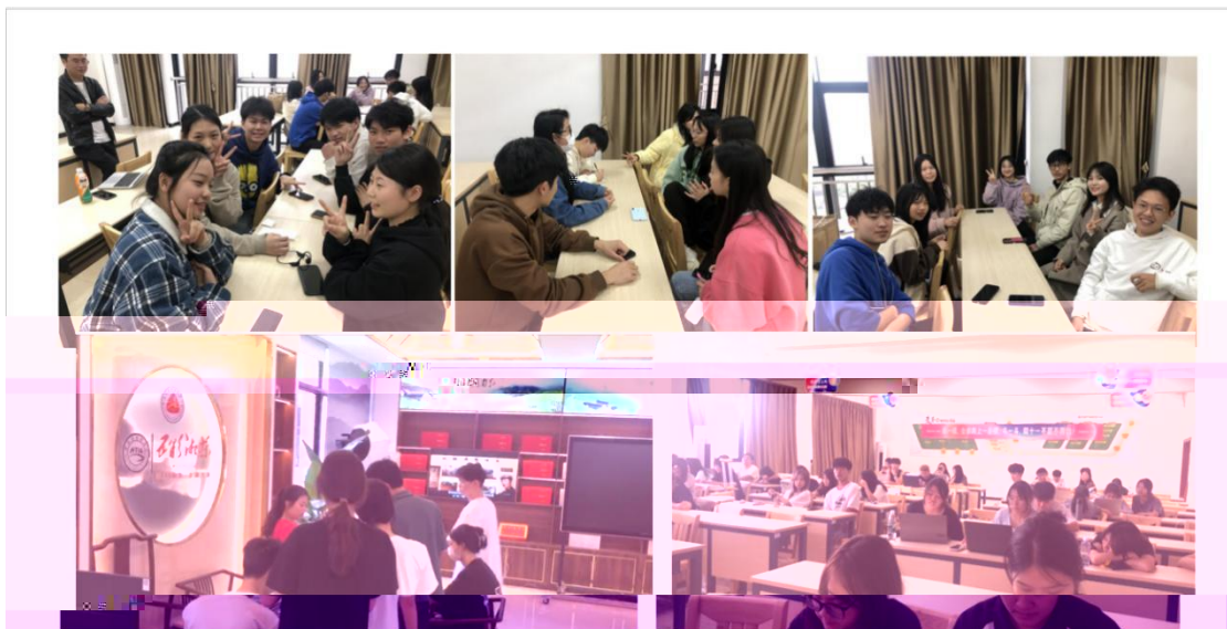
中国留学美国选拔项目